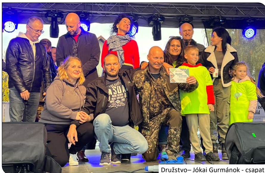
Družstvo – Jókai Gurmánok - csapat