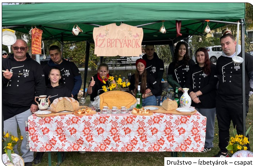
Družstvo – Ízbetyárok – csapat