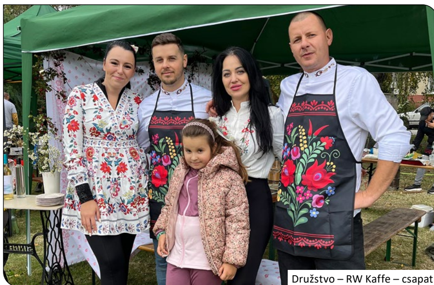
Družstvo – RW Kaffe – csapat