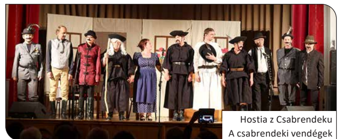
Hostia z Csabrendeku A csabrendeki vendégek