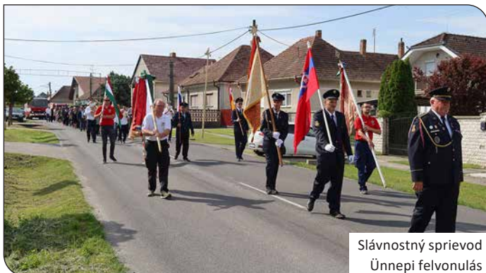
Slávnostný sprievod Ünnepi felvonulás