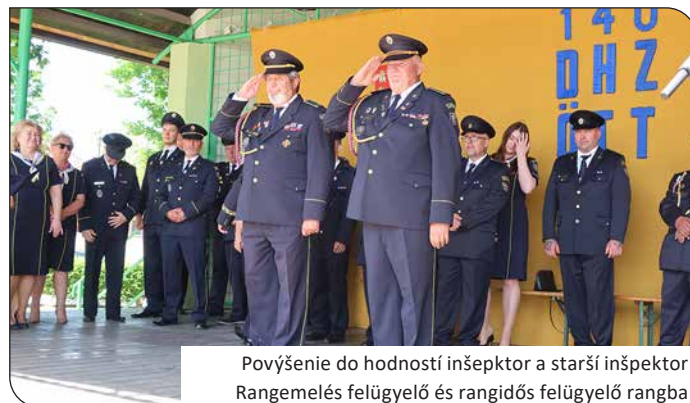
Povýšenie do hodností inšpektor a starší inšpektor Rangemlést felügyelő és rangidős felügyelő rangba