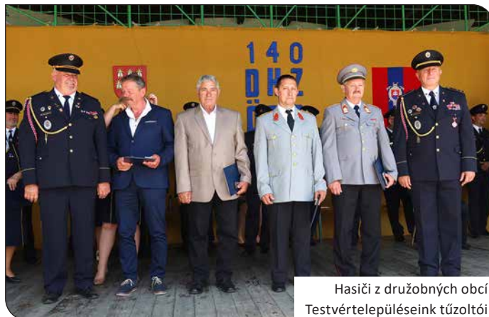
Hasiči z družobných obcí Testvértelepüléseink tűzoltói

a kívülállók igen gyorsan elfelejtenek. Az emberek nagy többsége csak baj esetén szembesül a tűzoltók veszélyes, embert próbáló munkájával. Sokszor el sem tudják képzelni, hogy mekkora fizikai, szellemi erőfeszítést és koncentrációt igényel a felkészülés, az, hogy embertársaik életét, testi épségét úgy tudják menteni, hogy közben maguk is épségben maradjanak. Azonban ez nem mindig sikerül, mert a természeti elemek sokszor erősebbek, mint az ember. A legfontosabb azonban az, hogy önök mindig segítő kezet nyújtanak a rászorulóknak. Ez a humánus gondolat kíséri a tűzoltóink munkáját 1885 óta. Ezért szeretnék a Nagyfődémesi Önkéntes Tűzoltó Testület minden tagjának elsősorban jó egészséget kívánni, hogy továbbra is kihasználhassák a megszerzett tapasztalatokat, és hogy szeretettel és önfeláldozással végezzék nemes küldetésüket.