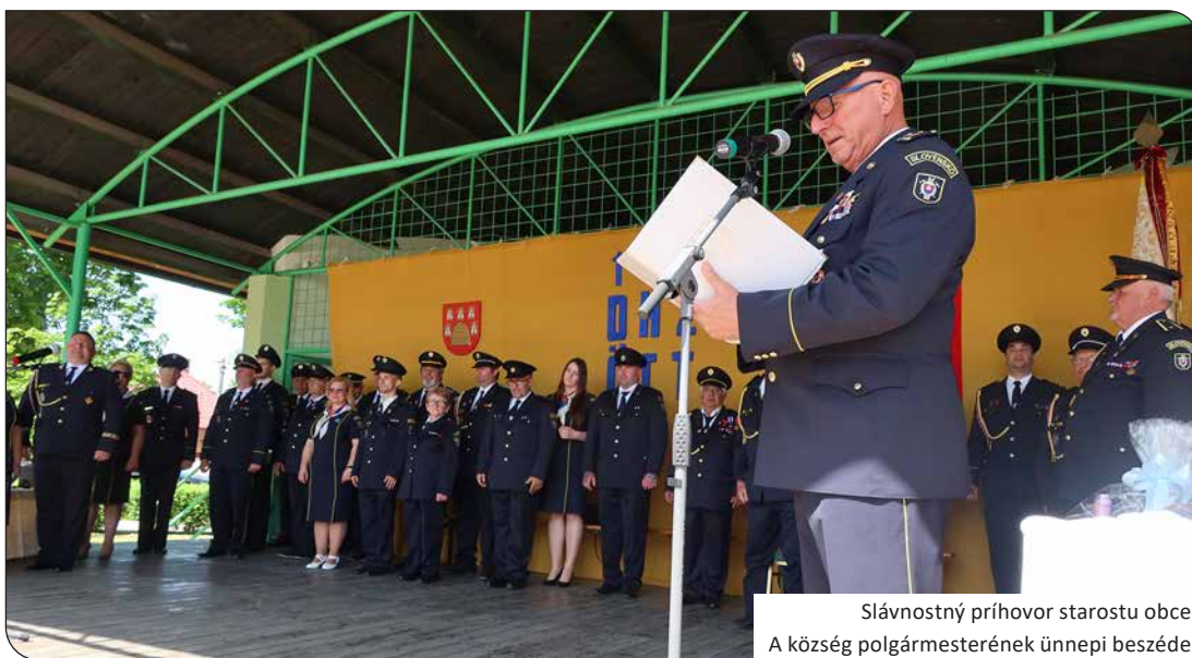
Slávnostný príhovor starostu obce A község polgármesterének ünnepi beszéde

a kívülállók igen gyorsan elfelejtenek. Az emberek nagy többsége csak baj esetén szembesül a tűzoltók veszélyes, embert próbáló munkájával. Sokszor el sem tudják képzelni, hogy mekkora fizikai, szellemi erőfeszítést és koncentrációt igényel a felkészülés, az, hogy embertársaik életét, testi épségét úgy tudják menteni, hogy közben maguk is épségben maradjanak. Azonban ez nem mindig sikerül, mert a természeti elemek sokszor erősebbek, mint az ember. A legfontosabb azonban az, hogy önök mindig segítő kezet nyújtanak a rászorulóknak. Ez a humánus gondolat kíséri a tűzoltóink munkáját 1885 óta. Ezért szeretnék a Nagyfődémesi Önkéntes Tűzoltó Testület minden tagjának elsősorban jó egészséget kívánni, hogy továbbra is kihasználhassák a megszerzett tapasztalatokat, és hogy szeretettel és önfeláldozással végezzék nemes küldetésüket.