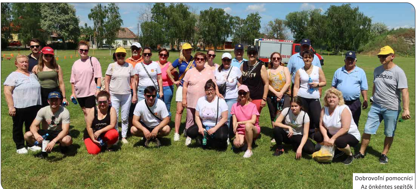
Dobrovoľní pomocníci Az önkéntes segítőék