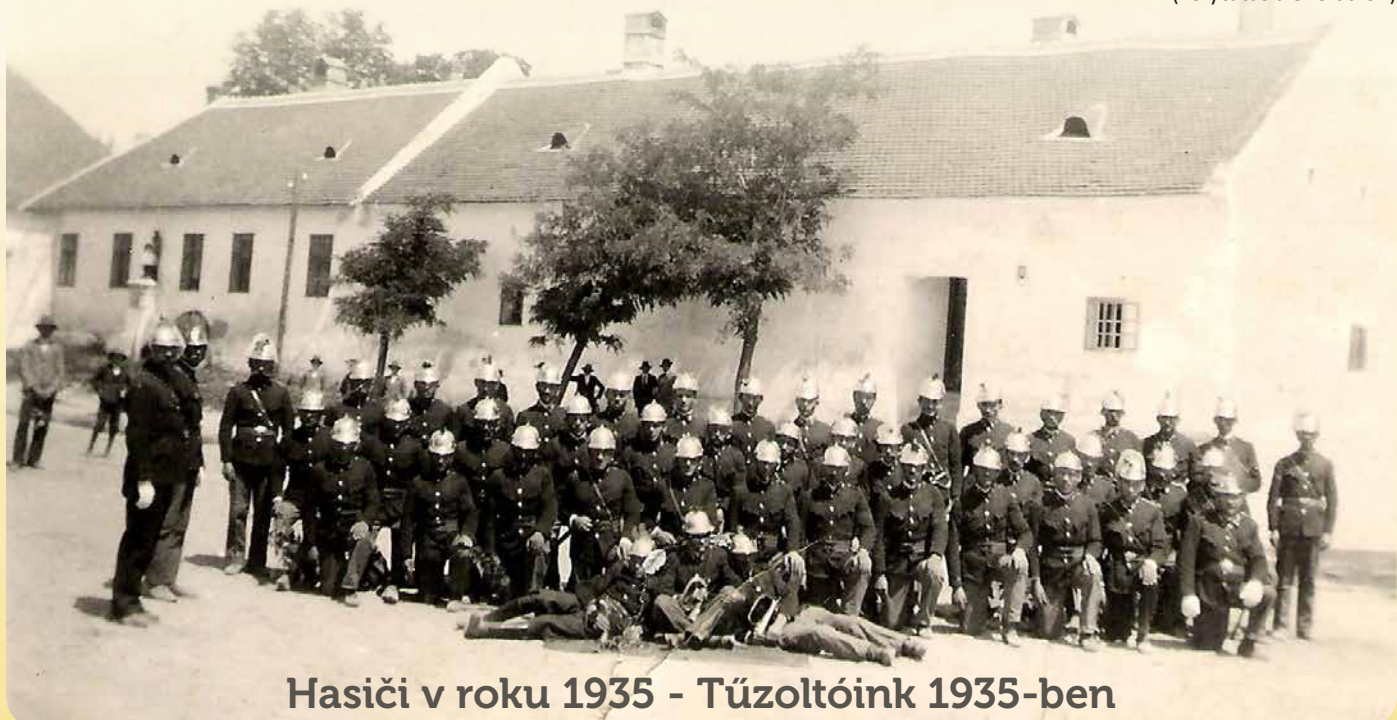
Hasiči v roku 1935 - Tűzoltóink 1935-ben