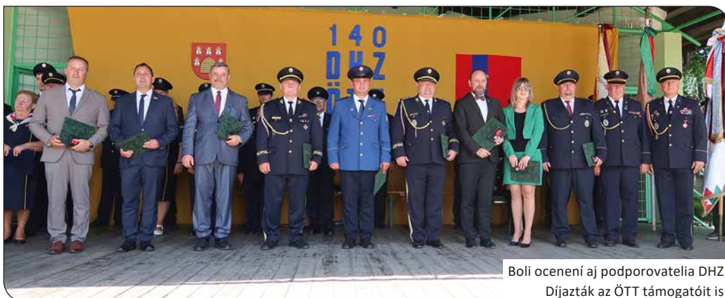
Boli ocenení aj podporovatelia DHZ Díjazzták az ÖTT támogatóit is