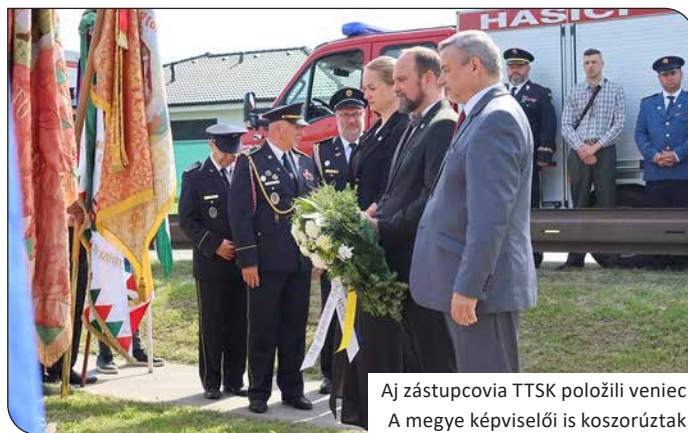
Aj zástupcovia TTSK položili veniec A megye képviselői is koszorúztak