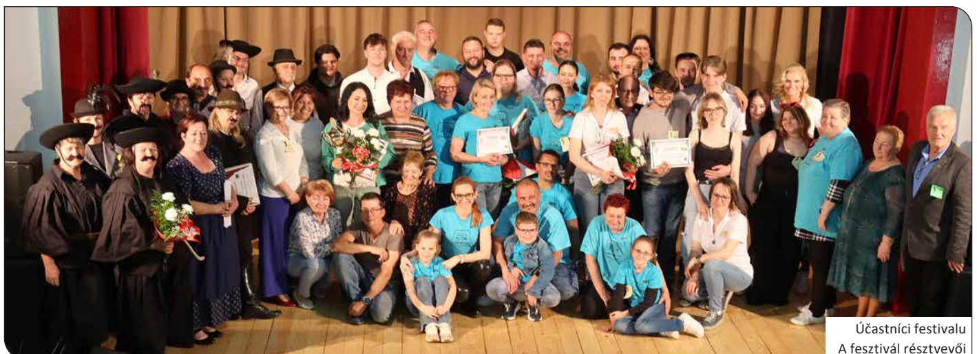
Účastníci festivalu A fesztivál résztvevői