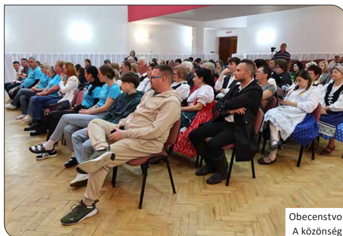
Obecenszövetség A közönség