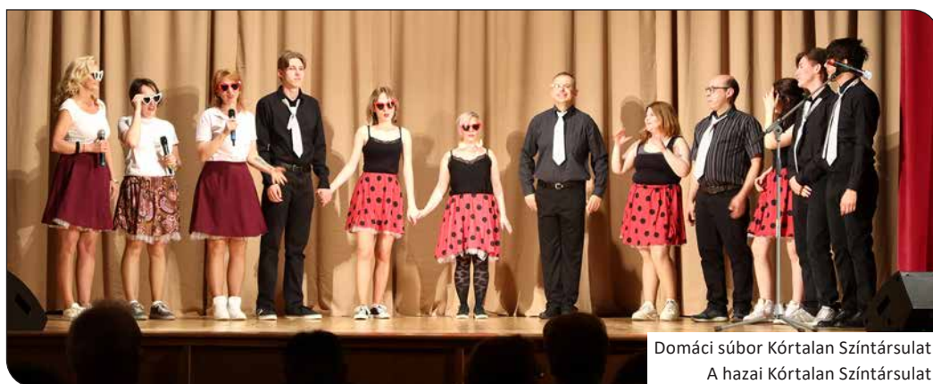
Domáci súbor Kórtalan Színtársulat A hazai Kórtalan Színtársulat

Výkony súborov hodnotila trojčlenná odborná porota, ktorá po každej inscenácii poskytla her-