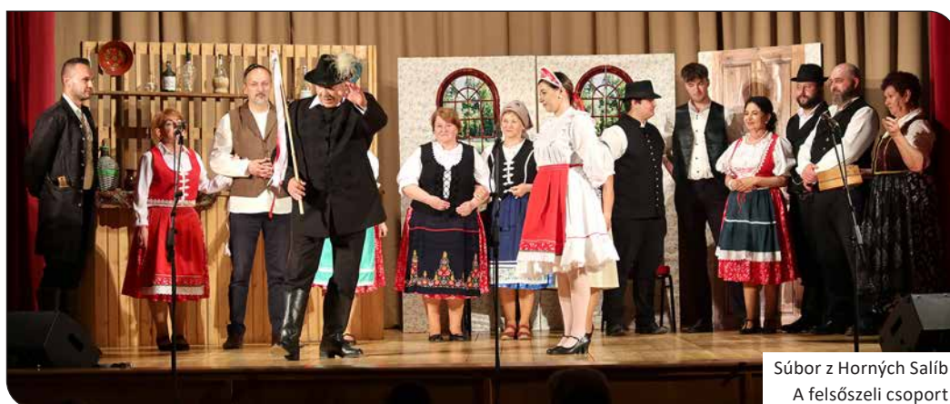
Súbor z Horných Salíb A felsőszeli csoport